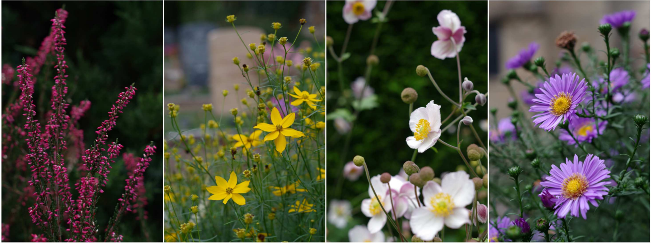
(von links nach rechts: Heide, Coreopsis, Anemone, Aster)